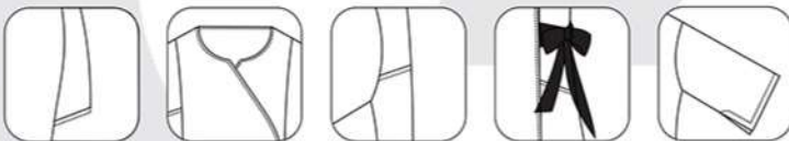
Poches basses dans découpes